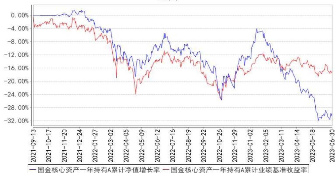
国金核心资产一年持有A累计净值增长率与同期业绩比较基准收益率的历史走势对比图